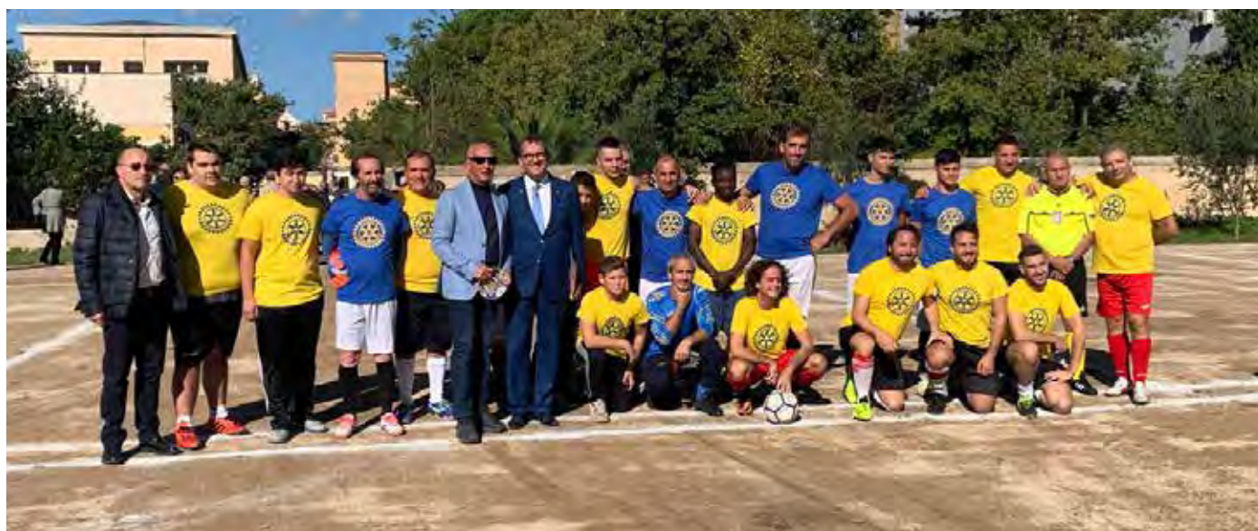
Partinico, inaugurazione campi