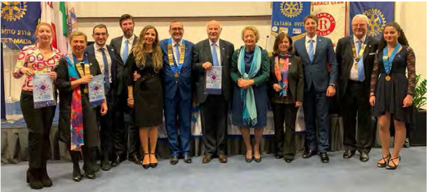
Catania Est, Catania Ovest