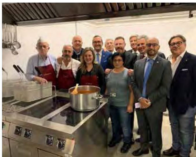
Palermo, consegna mensa al Don Orione