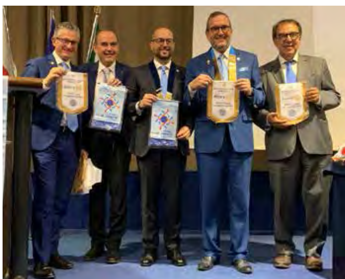
Palermo Baia dei Fenici, Palermo Teatro del Sole