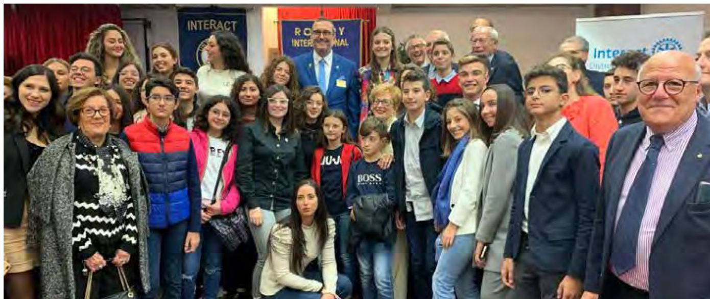
Assemblea distrettuale Interact