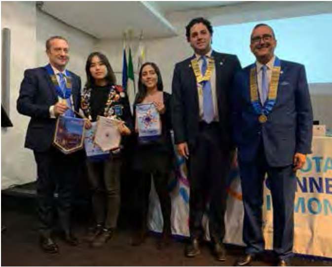
Catania Nord, Catania Sud