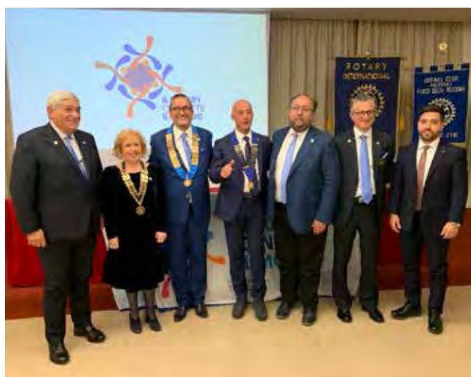
Palermo Costa Gaia, Palermo Parco delle Madonie