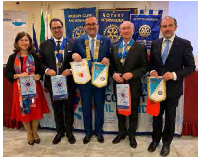
E-Club 2110, Misterbianco