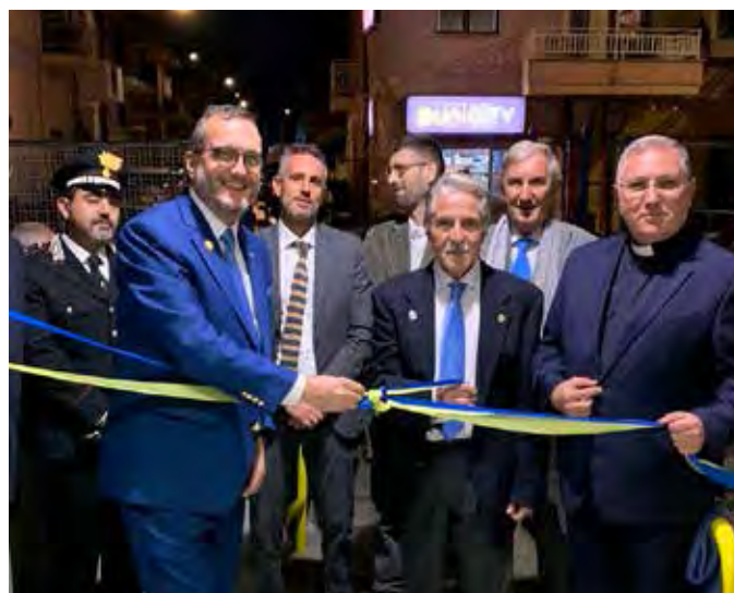
Ribera, inaugurazione centro assistenza