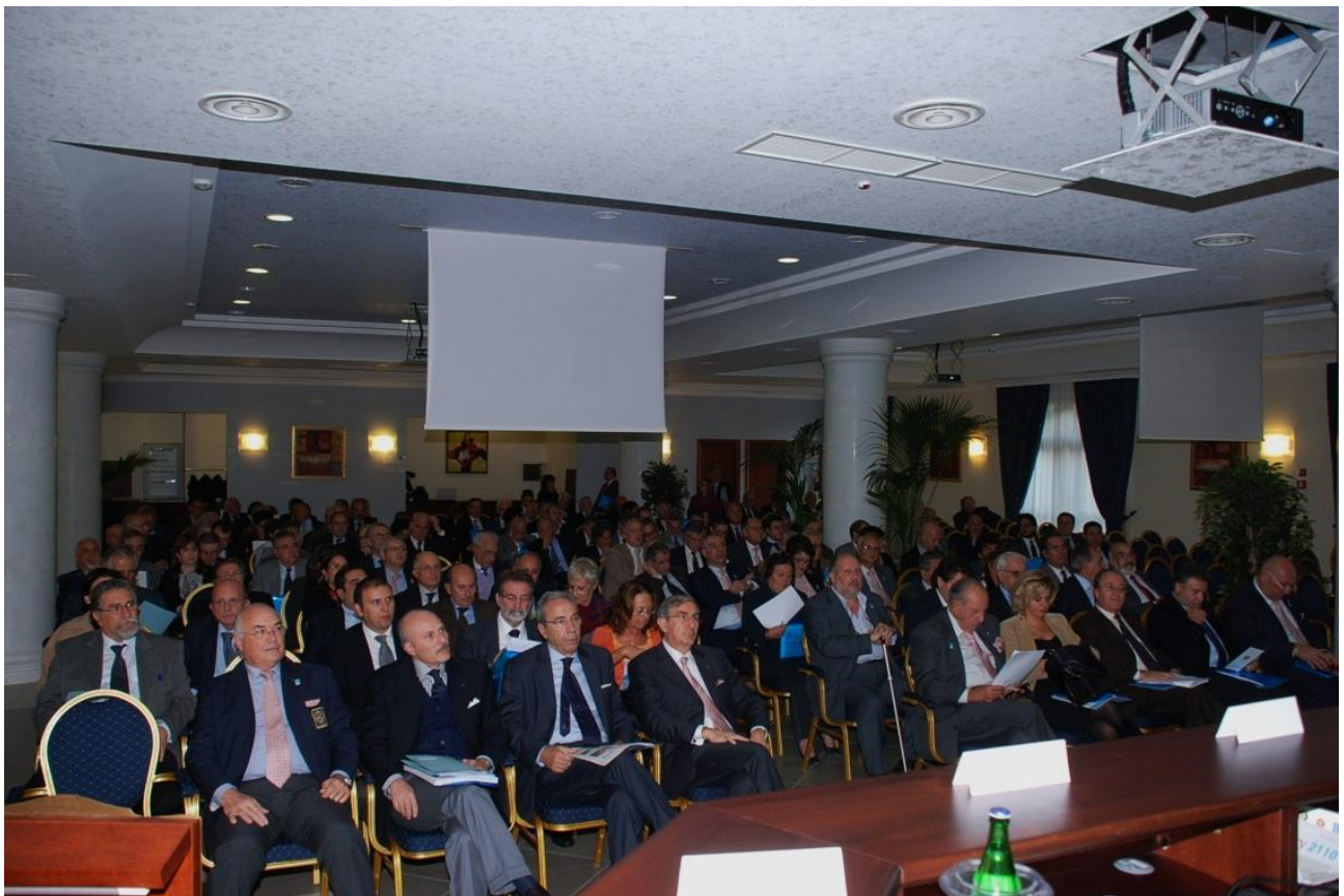
FORUM SULLA ROTARY FONDAZIONE 17 NOVEMBRE A ENNA