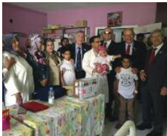
Cerimonia di consegna dei microinfusori nel Day Hospital di pediatria dell'ospedale Al Farabi