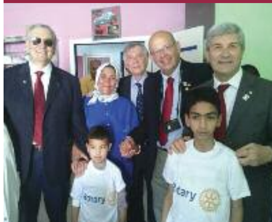
La cerimonia di consegna dei microinfusori a Oujda