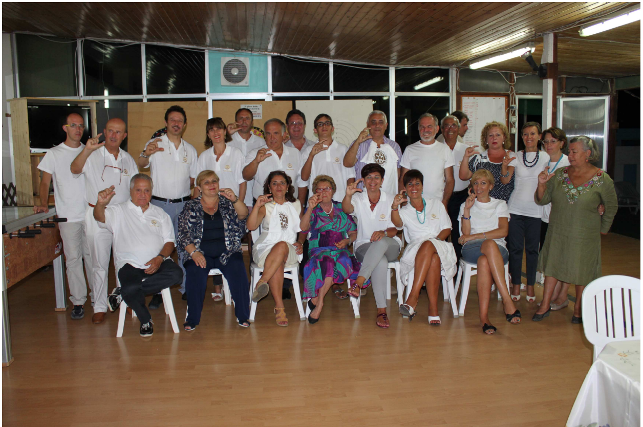
R.C TRAPANI BIRGI MOZIA E TRAPANI ERICE – sporting club