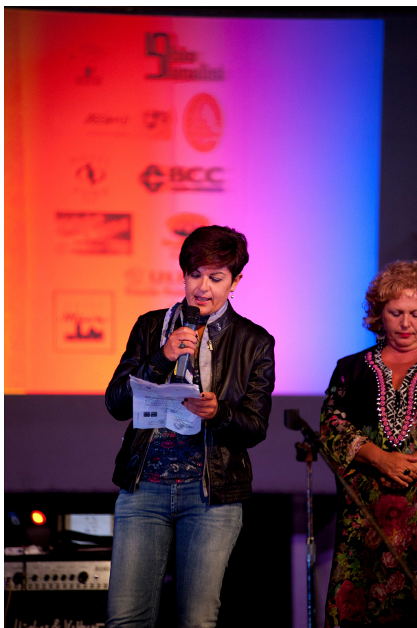
Il ringraziamento del presidente R.C. alla città di Erice