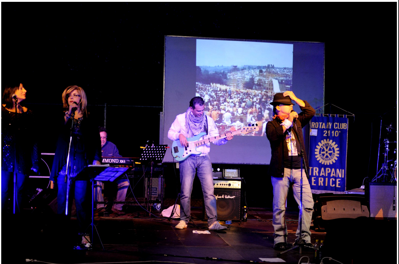
IL GRUPPO MUSICALE SIXTY FIVE SEVENTY FIVE