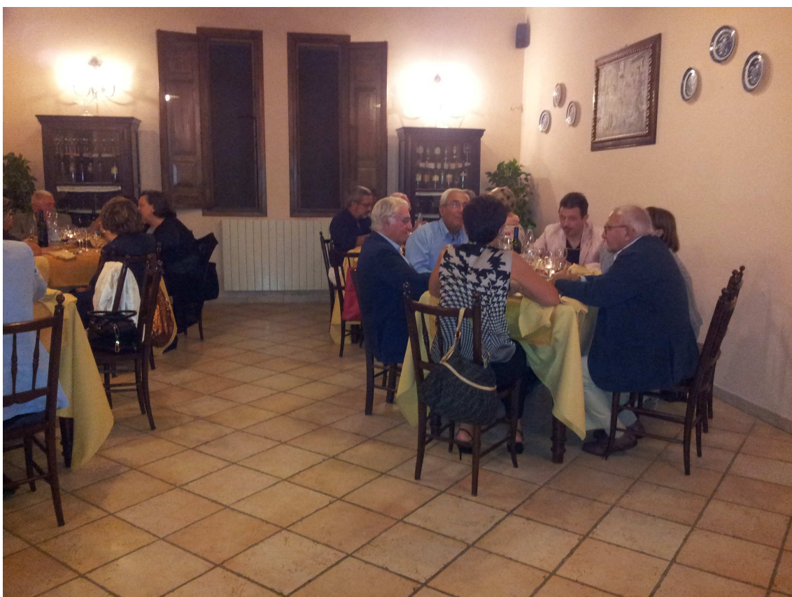
21 settembre – Direttivo e Caminetto tra i soci a Villa Immacolatella