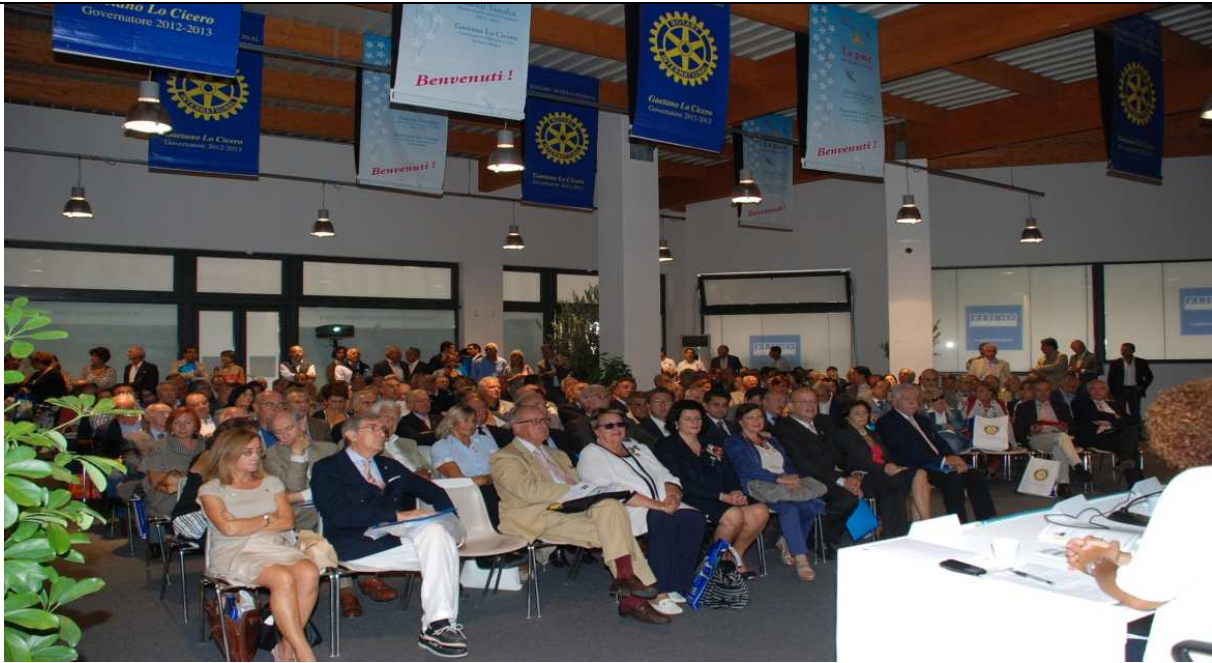
FESTA DELL'AMICIZIA AD AGIRA –OUTLET VILLAGE 22-23 SETTEMBRE – LAVORI