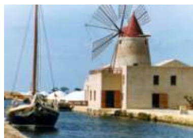
SALINE ETTORE E INFERSA

Serata di beneficenza a Mozia con tutti i club dell'area Drepanum c/o le saline Ettore e Infersa, I partecipanti sono convenuti alle 17:00 per una gita sull'isola, visita al museo del sale, raccolta dei fiori di sale all'interno delle saline; la serata si è conclusa con un'apericena al tramonto al ristorante Mammacaura c/o l'imbarcadero di Mozia.. Sponsor della serata sono stati le Cantine Fina di Marsala, mentre il complesso di musica jazz "Working in progress" ha allietato la serata con la sua melodiosa musica.