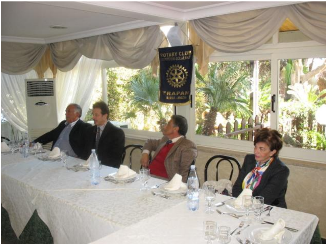
ORE 11:30 ASSEMBLEA DEI SOCI ED ELEZIONE PRESIDENTE 2014-2015