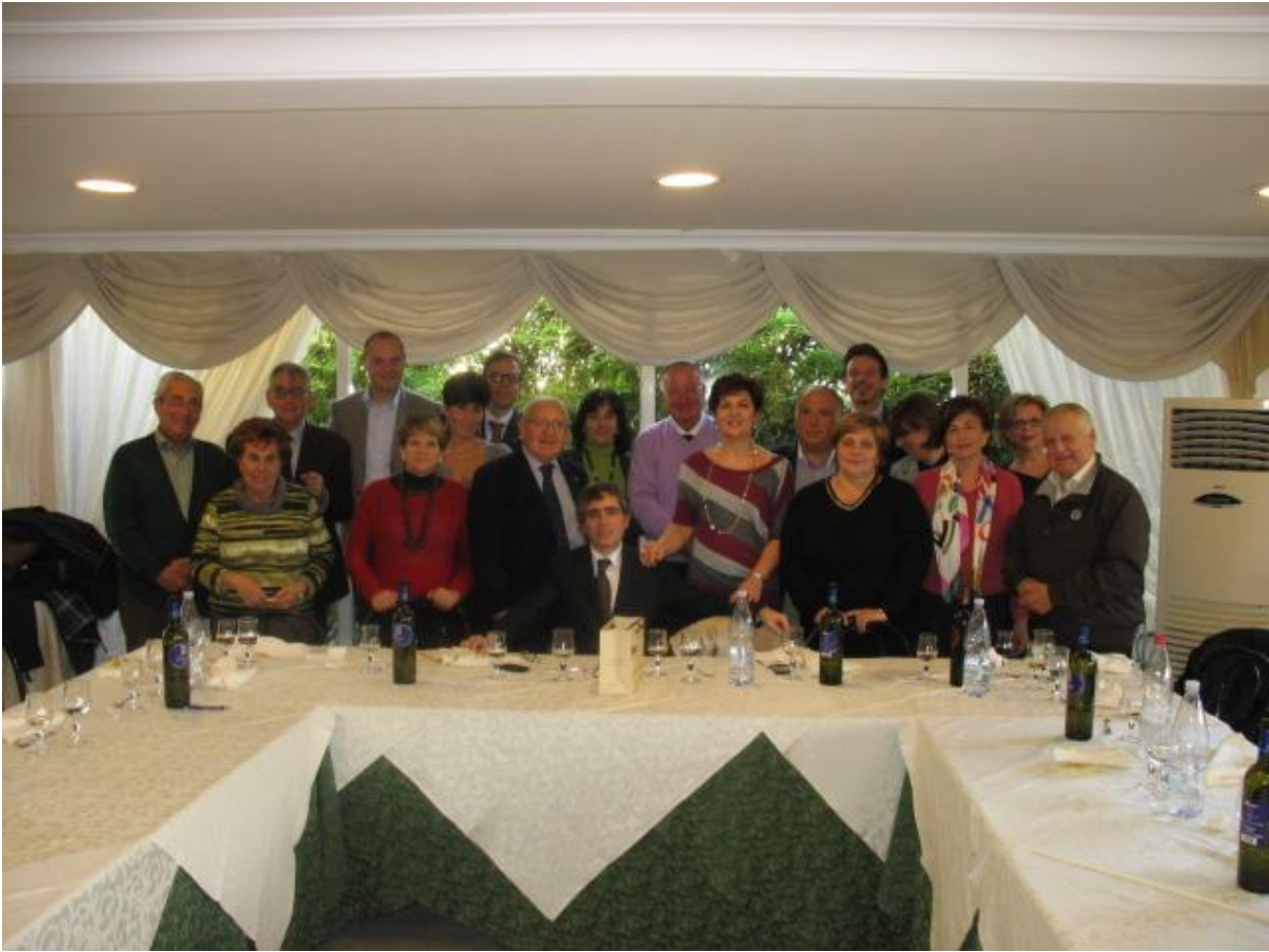
ORE 13:00 PRANZO CON LE FAMIGLIE