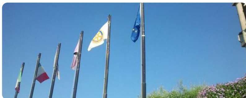
La bandiera del Rotary International all'ingresso dello Sheraton Catania