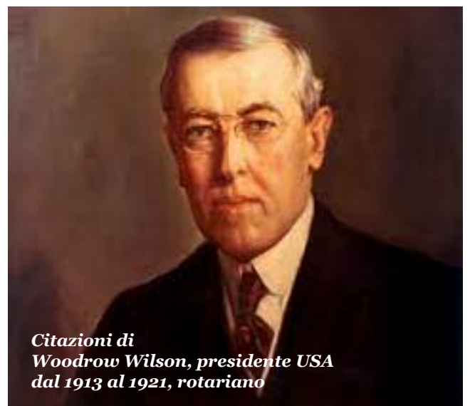
Citazioni di Woodrow Wilson, presidente USA dal 1913 al 1921, rotariano