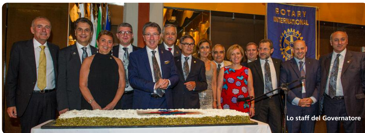
Lo staff del Governatore

“ Ripeto in questa sede, di non aspettarmi pranzi o cene in occasione del mio passaggio dai vostri Club né tantomeno regali, ma solo un cocktail che possa farvi risparmiare e dare a me l'opportunità di conoscere e intrattenermi con il maggior numero di soci ”