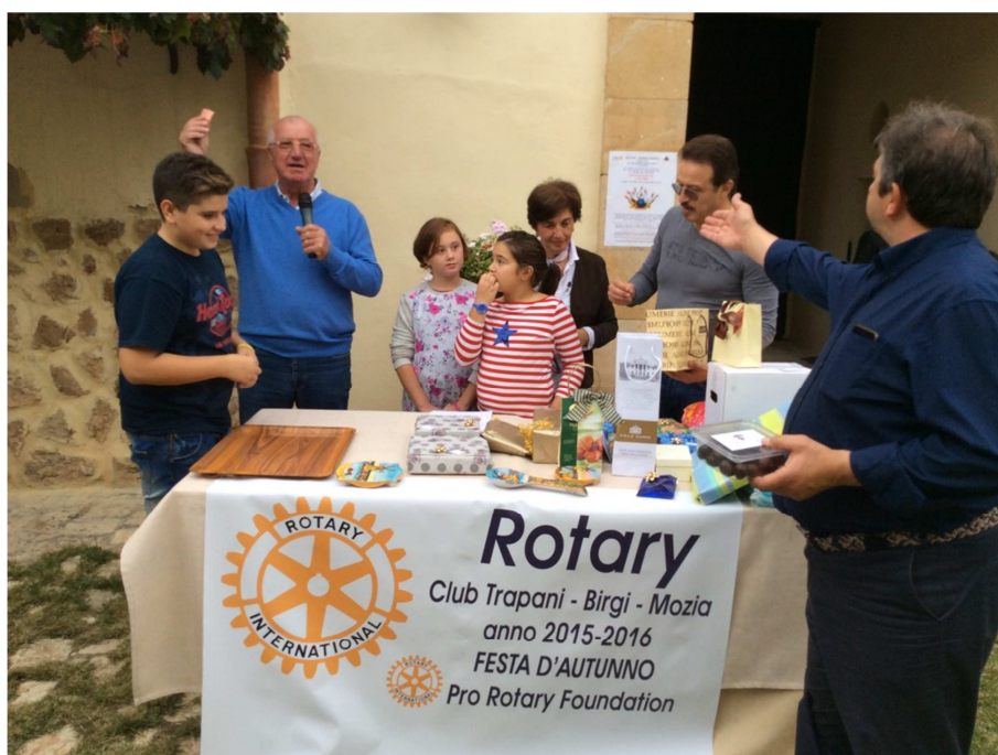
Un momento delle raccolta fondi pro Rotary Foundation