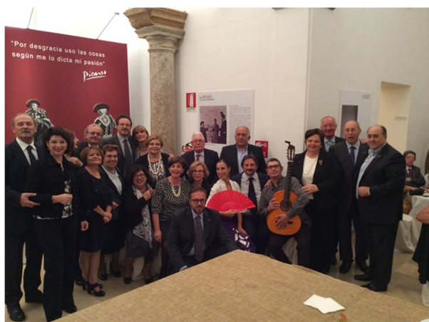
Foto di gruppo con ballerina di Flamenco