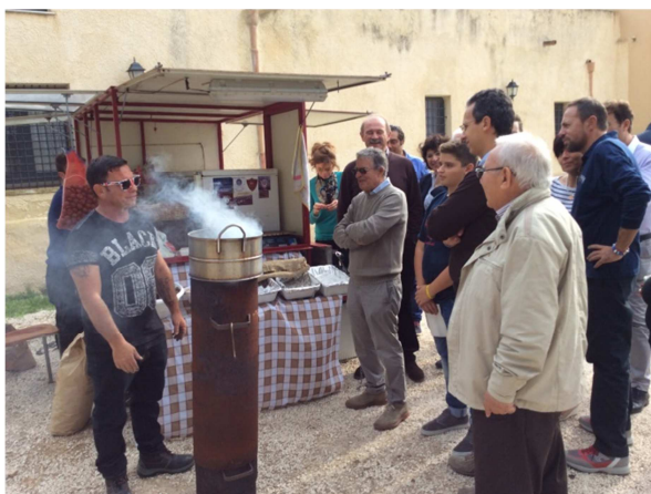
Tutti in fila per le caldarroste novità della festa d'Autunno