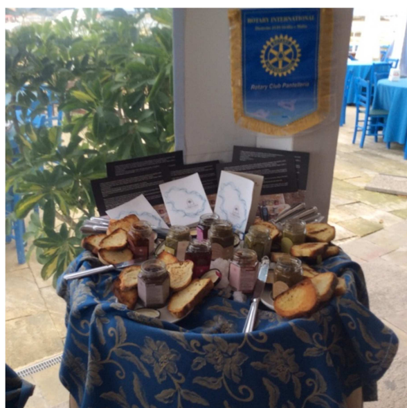
I paté del club di Pantelleria