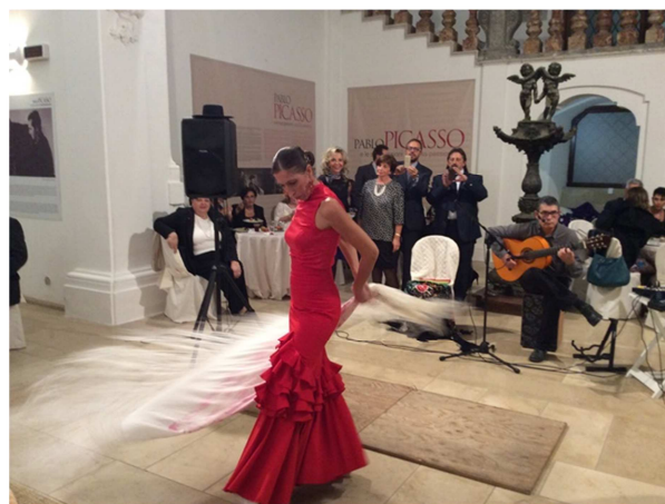
La ballerina di flamenco ed il chitarrista