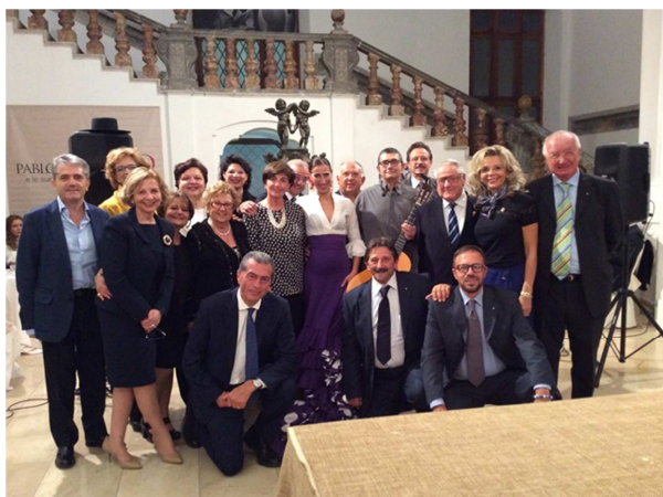
I soci della Rotary al museo Pepoli durante la visita alla mostra di Picasso

I club Rotary Trapani, Rotary Trapani Erice e Rotary Trapani Birgi si incontrano al museo Pepoli in occasione della mostra “Picasso e le sue passioni”