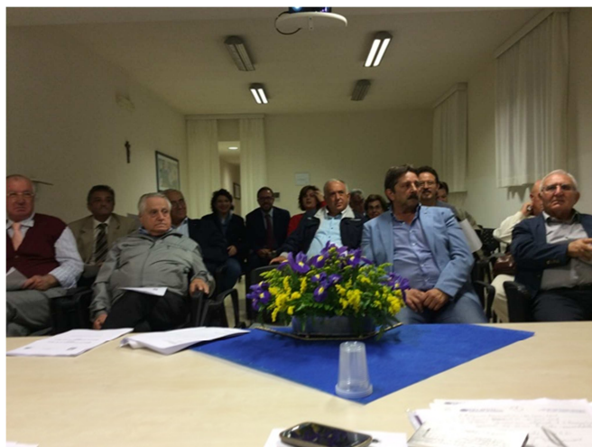
I soci durante l'assemblea (altissima partecipazione)