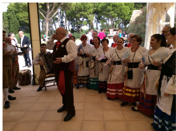
Il gruppo "Trapani Mia" altra novità della festa d'Autunno