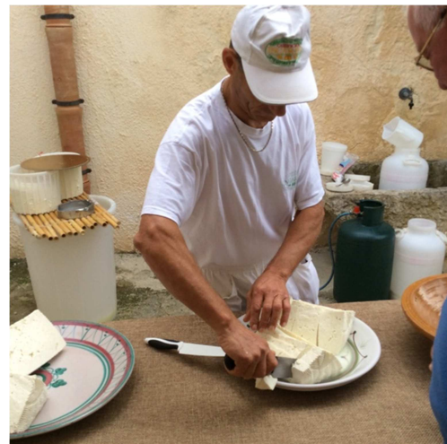
Il ricottaro del Caseificio Ingardia prepara la ricotta e la tuma