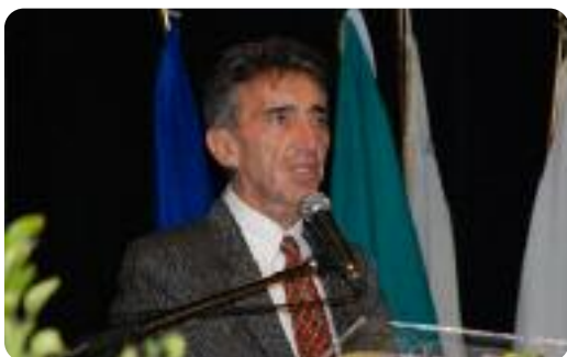
Nino Caleca, assessore regionale all'Agricoltura

Grande attenzione, al Forum hanno avuto le riflessioni sull'educazione alimentare. Le campagne alimentari devono modificare un modello culturale devastante per le giovani generazioni. Occorre recuperare la responsabilità genitoriale nell'alimentazione e nella costruzione dei comportamenti. Se la magrezza è un valore, anche il rapporto con il cibo è alterato e promuoviamo forme di anoressia sociale. I cattivi comportamenti alimentari devono essere modificati anche da strategie politiche per l'utilizzo dei prodotti migliori a prezzi contenuti per produrre salute: per mangiare sano dovunque, a casa, a scuola, nelle mense, al ristorante.