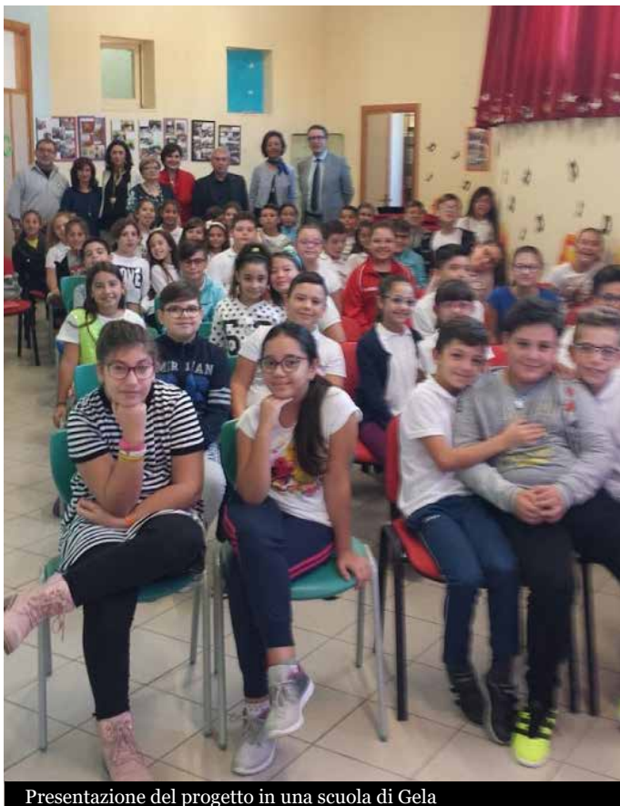
Presentazione del progetto in una scuola di Gela

Mai come adesso, il cibo è il nostro futuro. La popolazione mondiale continua a crescere; l'obesità sta aumentando ai massimi livelli, mentre l'insicurezza alimentare costringe le persone a migrare. Il cibo viene sprecato invece di nutrire gli affamati e, da qualsiasi angolazione lo si consideri, lo spreco è un danno. Dobbiamo affrontare queste sfide adesso: è l'unico modo per garantire un futuro all'umanità, al nostro pianeta, a tutti noi. La parola "chiave" diventa allora "prevenzione": fare "prevenzione" significa agire prima che il danno sia fatto. Ma come si fa prevenzione dello spreco alimentare?