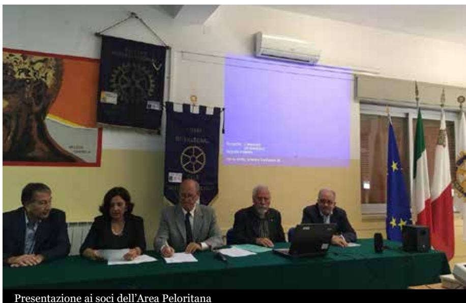
Presentazione ai soci dell'Area Peloritana