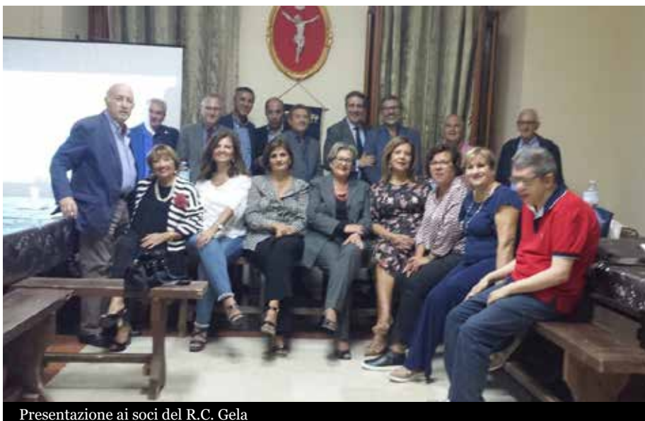
Presentazione ai soci del R.C. Gela