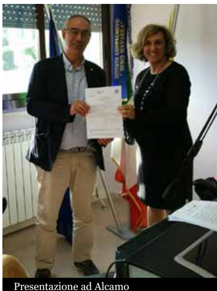
Presentazione ad Alcamo