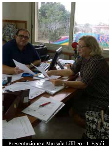
Presentazione a Marsala Lilibeo - I. Egadi