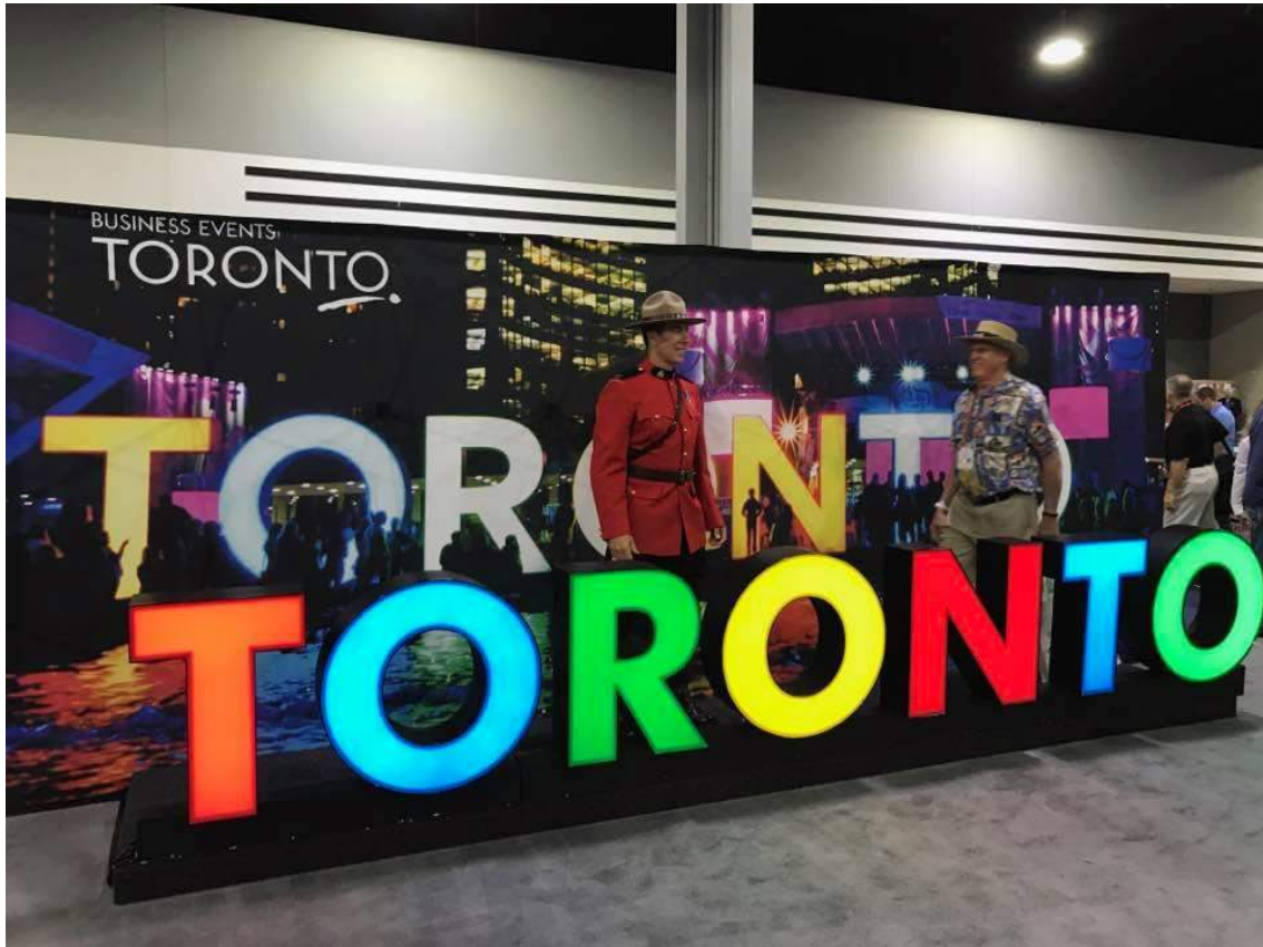
Arrivederci alla Convention di Toronto 2018