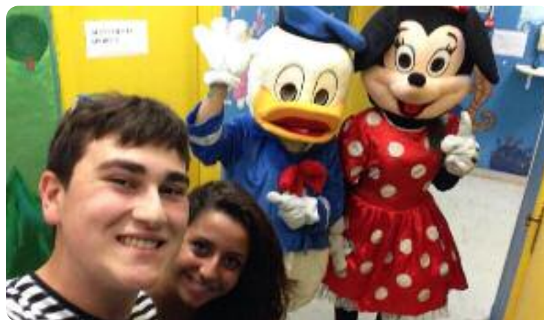
Foto 1 - Impegno e divertimento nel service dei giovanissimi

Nel Distretto 2110 sono attivi 31 Club Interact, con 426 soci così raggruppati per aree: zona Akragas 2 club, 29 soci; Aretusea 3 club, 41 soci; Drepanum 7 club, 101 soci; Etna 3 club, 41 soci; Iblea 3 club, 53 soci; Nissena 2 club, 14 soci; Panormus 4 club, 25 soci; Peloritana 2 club, 28 soci; Terre di Cerere 4 club, 76 soci; Malta 1 club, 18 soci.