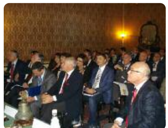
Le immagini del Pre Sipe che si è tenuto a Palermo il 25 ottobre