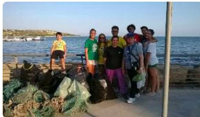
Foto 3 - Gli interactiani ripuliscono il Lungomare di Augusta