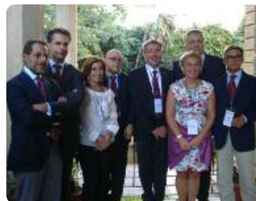
Alcuni scatti del Pre Sipe che si è svolto a Catania il 18 ottobre