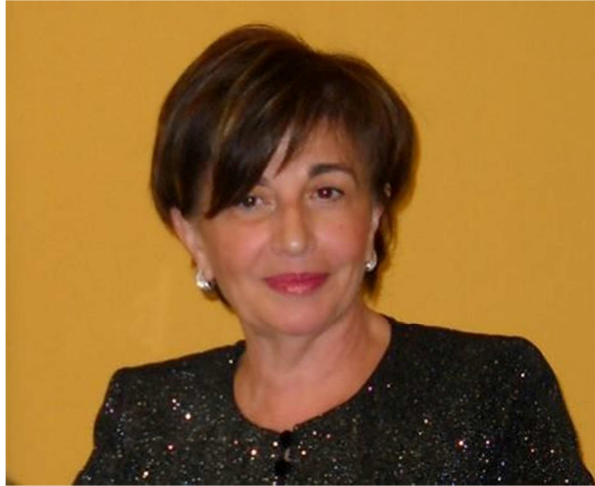
Presidente Vita Maltese