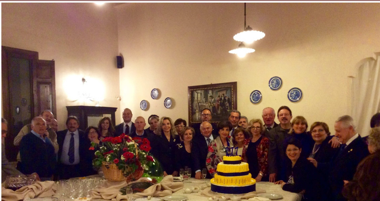
Foto di gruppo dei soci del R. C. Trapani Birgi Mozia con la torta dell'anniversario del Rotary