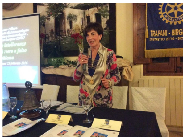
La presidente introduce l'argomento