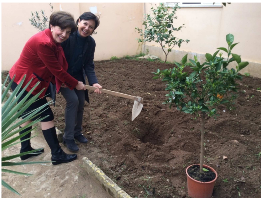
La Presidente Vita ed Adele preparano l'aiuola della scuola media Eugenio Pacelli di Paceco prima della piantumazione degli alberelli di arancio