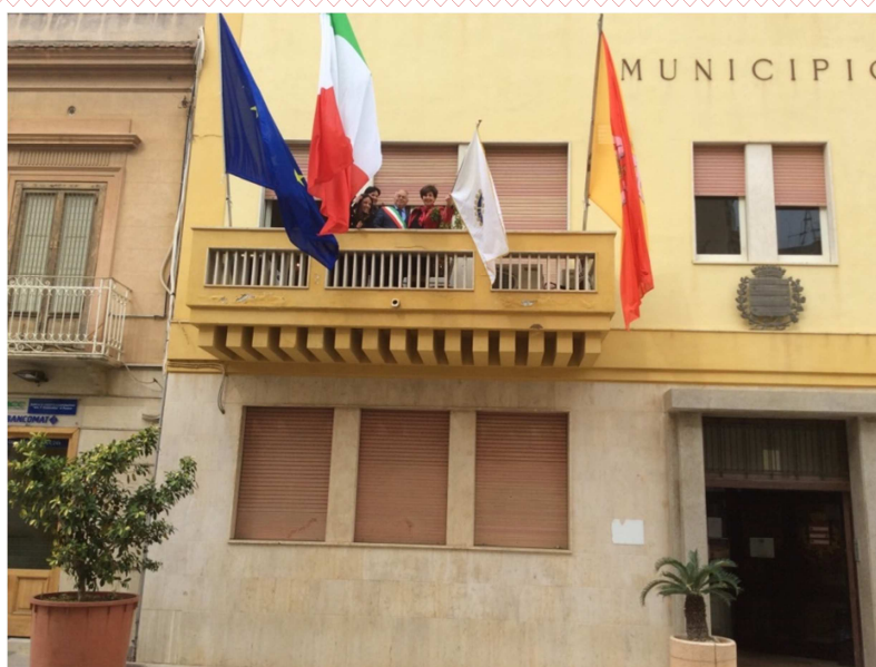
La bandiera del Rotary esposta al balcone dal Palazzo Municipale di Paceco