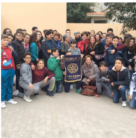
Gli studenti della scuola media Eugenio Pacelli di Paceco

La presidente, rivolgendosi agli studenti, ha ricordato la mission del Rotary nel mondo, la figura del fondatore del club Paul Harris, che donava una pianta in ogni città che visitava, il ruolo del club, che attraverso il programma polio plus con l'aiuto della fondazione di Bill Gates ha promosso la diffusione del vaccino in quei paesi in cui la situazione politica e sanitaria non lo aveva favorito. L'attenzione che il Rotary rivolge ai giovani di tutto il mondo attraverso l'istituzione di Borse di studio, scambio giovani, corsi di comunicazione e leadership l'istituzione di club di giovanissimi come l'Interact ed il Rotaract.