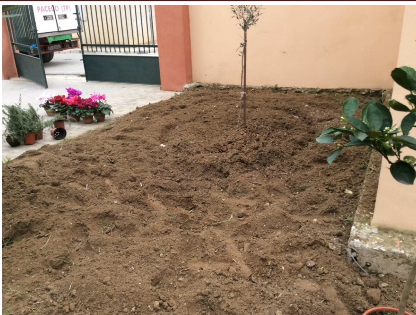
L'aiuola prima della piantumazione