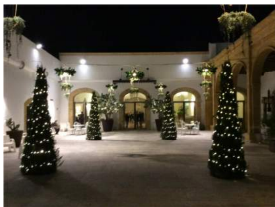
Natale a Villa Favorita

Foto relative alla festa degli Auguri per il Natale 2015 che si è svolta il 20 dicembre 2015 presso i locali Villa Favorita di Marsala, assieme agli amici del Rotary Marsala Lilibeo Isole Egadi.