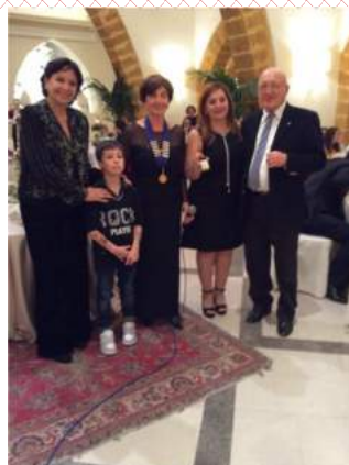
Una ospite del club Marsala porta via i preziosi orecchini