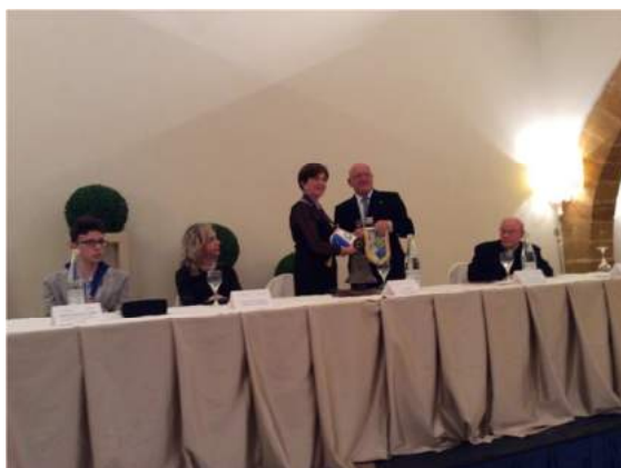
I due Presidenti si scambiano i gagliardetti dei club