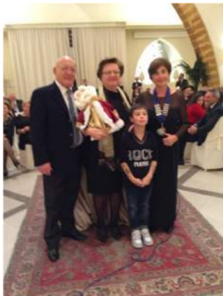
La moglie di un socio del Marsala Lilibeo porta a casa il premio più ambito Babbo Natale Copripanettone