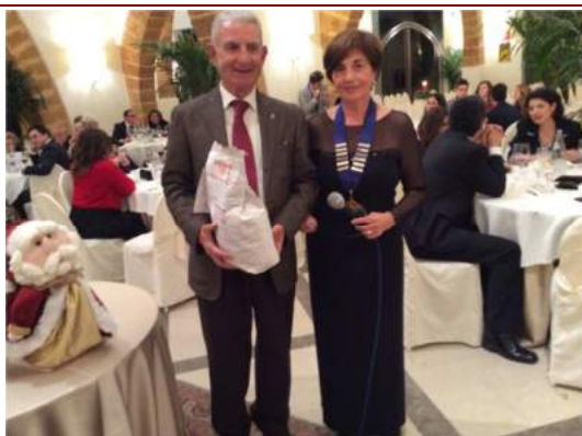
Un socio del Marsala ritira il sacco con la semola per il cuscus

Durante la serata è stato effettuato il sorteggio di un Babbo Natale Copripanettone, realizzato dalle signore del corso di pathwork, di un presepe in Capodimonte, offerto dalla gioielleria Amantia, di un Paio di orecchini, realizzati ed offerti da Rafy, una confezione di semola del mulino Giuseppe Grillo, hanno permesso ai soci di trasformare la serata in un momento di solidarietà in favore dei progetti della Rotary Foundation e per l'acquisto di vaccini antipolio per gli unici due paesi in cui ancora la malattia non è stata completamente debellata.