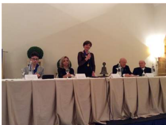
La presidente Vita Maltese rivolge agli amici ai soci ed agli ospiti presenti gli auguri di Natale