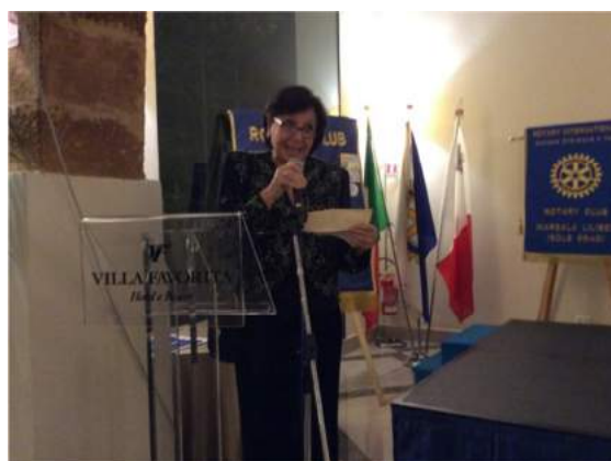
Il prefetto Adele Occhipinti