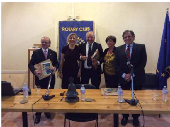
Foto di gruppo